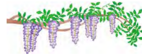
藤の花言葉は「歓迎」 藤の花はハートケア市川のシンボルマークです。