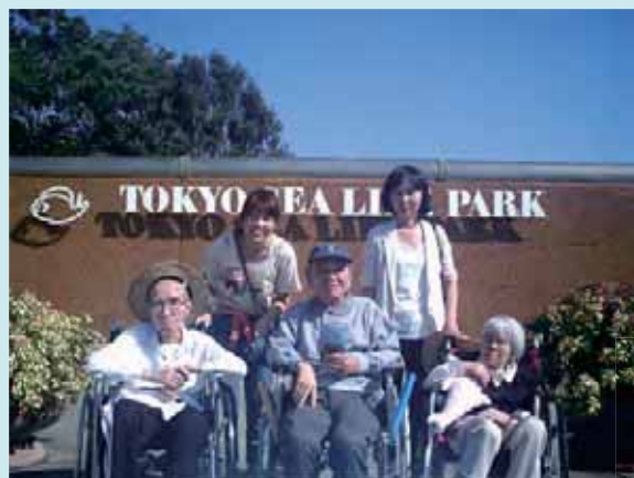
葛西臨海水族館ツアー とってもいい天気でした。